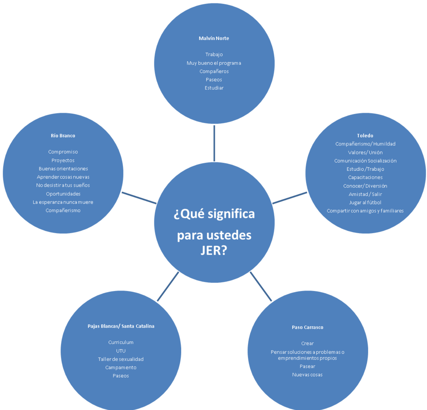
Diagrama 1: Lluvia de idea sobre significado de JER en grupos de Jóvenes Participantes